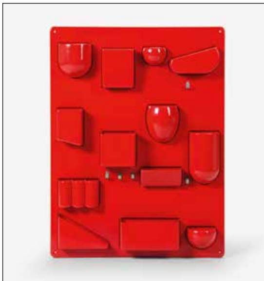
Uten Silo 2 - Dorothee Becker

Dans les années 1950 et 1960, la marque française de design "Prisunic" fait une campagne de publicité dont le slogan principal est : "Le beau au prix du laid" !