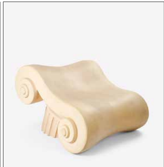
Capitello - Studio 65

Un tableau d'organisation, voilà une manière utile de décorer son intérieur.