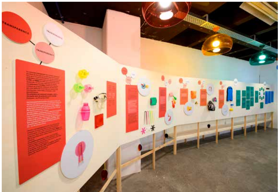
La PLASTICOTEK- Un lieu pour découvrir les matières plastiques

Le soufflage pour des films et des flacons : procédé consistant à souffler du plastique dans un moule pour créer une forme creuse.